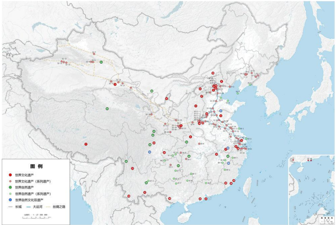
图2 中国世界遗产分布图