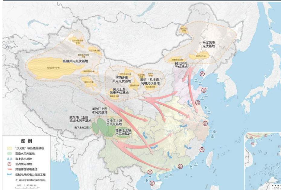
图1 清洁能源基地布局示意图

建设中俄远东天然气管道、川气东送二线天然气管道，推进中俄中线天然气管道前期工作。